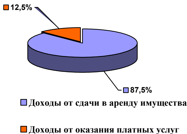
Структура неналоговых доходов МО Красносельское сельское поселение в проекте бюджета на 2021 год

Источниками поступлений неналоговых доходов в 2021 году являются: